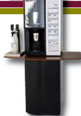
FERSKBRYGGER WITTENBORG FB 7100 - NYTRAKTET TRIVSEL!