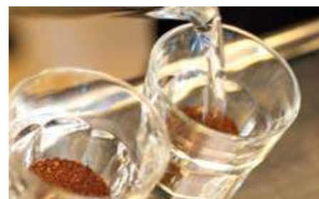
For at kaffen skal få den beste smaken brukes alltid nykokt vann.