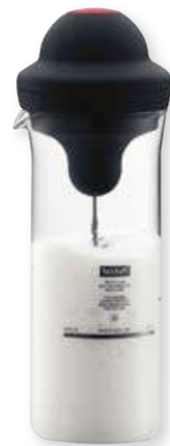
bodum® Granos: Mousse melkeskummersett 429,-