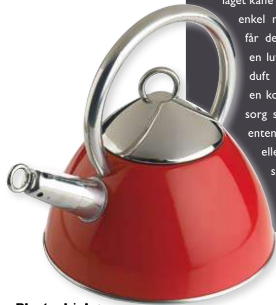
Plystrekjele: Rød 395,-

Gjør kjøkkenet om til din egen lille kafé med enkle redskaper. La duften av nylaget kaffe bre seg i kjøkkenet. Med en enkel melkeskummer for hånden, får det ferdigbryggede resultatet en luftig smak av melkeskum. La duft og smak smelte sammen i en kopp valgt med like stor omsorg som du har brygget kaffen, enten du har gjort det på nye eller gamlemåten. Hvem har sagt du må gå på kafé for å hygge deg?