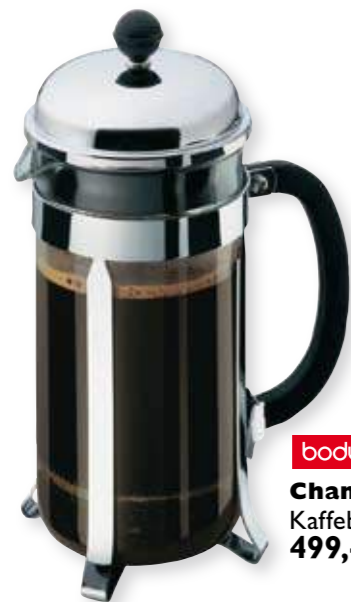
bodum® Chambord: Kaffebrygger 8kp 499,-