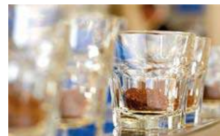
Kaffen som skal testes legges i hvert sitt glass. I tillegg står det et glass med vann til skylning.

kaffe, det femte er fylt med vann til skylning. Ved hver gruppe står det også to fat, ett med rå og ett med brente kaffebønner slik at innkjøperne kan ta dem i øyesyn. Utstyrt med skje og spytteglass begynner de profesjonelle med testarbeidet for å kategorisere smak og aroma. Det cuppes flere glass med den samme kaffen. Kaffen må i størst mulig grad være "uniform", dvs. ikke avvik i mellom de ulike prøvene. I ett parti med kaffe, kan selv et par dårlige bønner ødelegge. Framgangsmåten kan virke noe sær for en amatør, men når proffene slurper i seg kaffen, handler det ikke om dårlig folkeskikk: Kaffen spres i munnen, som gjennom en dyse. Den blander seg med luft og treffer tungens