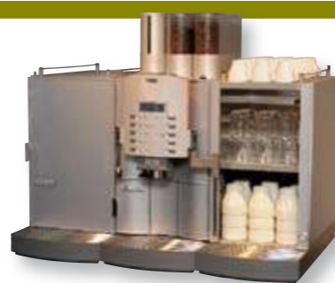
FRANKE SPECTRA – REN ELEGANSE, REN SMAK, REN NYTELSE

House of Coffee • Tlf. 815- KAFFE (52333) • Faks 850 202 33 • post@house-of-coffee.no