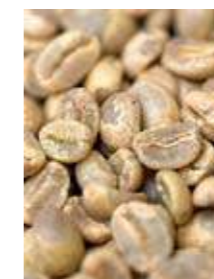
Rå kaffebønner. Innkjøperne skal kunne se råvaren.