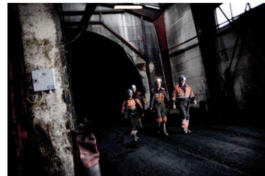
ETTER ENDT SKIFT strender gruve-arbeiderne til messa for en kopp god automatkaffe.

Dypet av dette industrielle gruvefjellet er en naturopplevelse. Mektig på samme vis som den enorme villmarken på utsiden. Når du står stille og ser på kuttmaskinen slå kullet ut av veggene meter for meter hører du ikke bare maskinene, men fosselyden i kullspruten fra kutteren. Ned langs samlebåndet lyder kullet som en bekk. Du