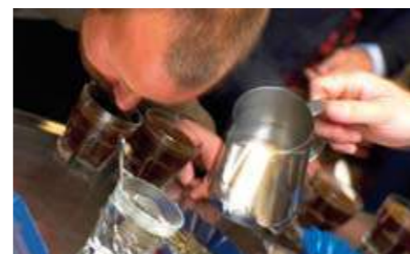
Kaffesmaking går ut på å kategorisere smak og aroma.