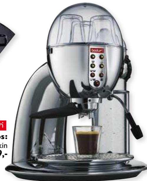
bodum® Granos: Espressomaskin 6.699,-

Finn din nærmeste Tilbordsbutikk på www.tilbords.no