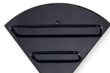
Filterholder: Svart 89,-