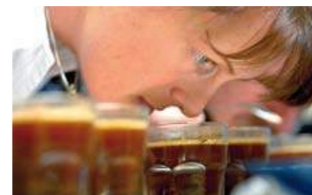
Skal man finne fram til riktig smak er det viktig å ha god nese.

Tekst: Torunn Dillan Pedersen