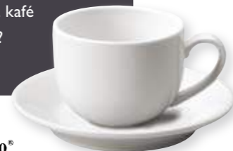
ConGusto® Cappuccinokopp: 20cl m/skål 71,-