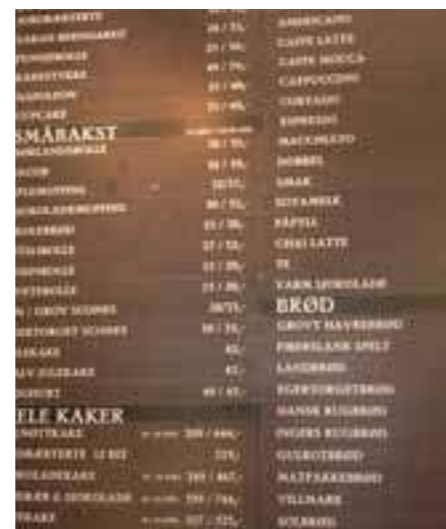
På Samson er kaffen og bakevarene like viktige

- Vi oppdaget litt for store variasjoner i kaffekvaliteten ved våre avdelinger og til ulike tider. Vi er ikke sterkere enn det svakeste leddet, og ville gjøre noe med dette. Den gode opplæringen fra NKI har derfor vært et unikt og nyttig tilbud for oss.