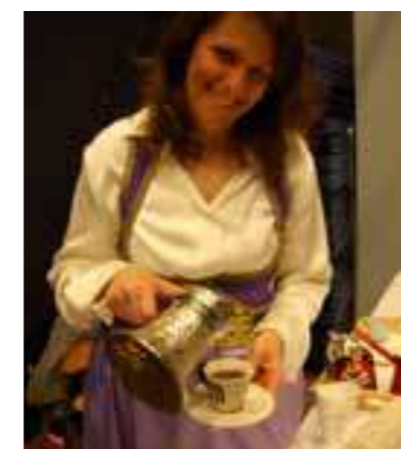
Tyrkisk kaffe ble også servert på Kaffefest 2013