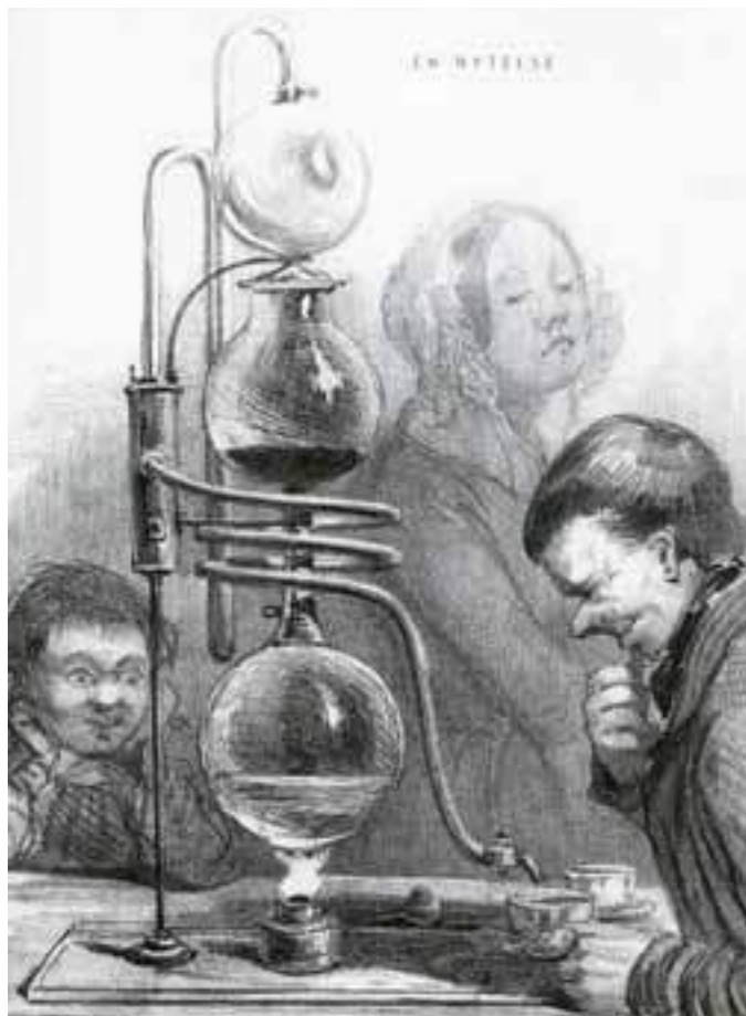
Kaffe har vært kjent som drikk i Norge siden 1600-tallet.