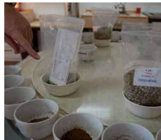
Når kaffen mottas i Oslo blir den straks sjekket og cuppet for å sikre at smaken og kvaliteten er i samsvar med skipningsprøven fra Brasil.

Brasil-produsenten en skipningsprøve av denne til Joh. Johannson Kaffe i Oslo. Her blir den brent, vurdert og cuppet for å sjekke at profilen er som ønsket.