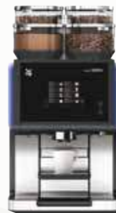
NYHET 2013! WMF 8000

Vi i Primulator mener at den beste kaffen lages av nykvænet fersk kaffe, ikke av sirup, pulver eller kapsler. – KVALITET –