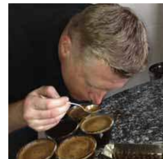
Ved å «brekke kaffen» kommer aromaen fram og en kan fort avdekke eventuelle defekter eller avvik i kvaliteten.

og de kan fortelle om utfordringer de måtte stå overfor, forteller innkjøpslederen.