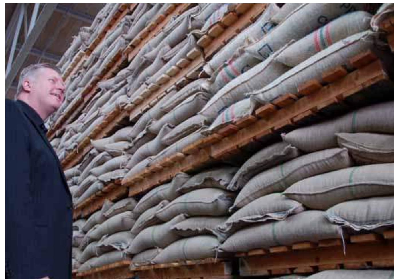
Brasil-kaffe levert og på lager i Oslo hos Joh. Johannson Kaffe, klar til produksjon.