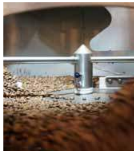
Brent kaffe som kjøles ned i cooling tray.