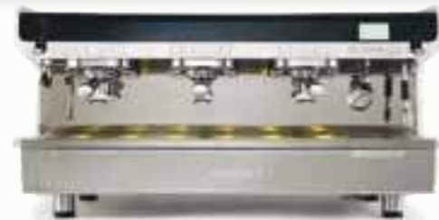
NYHET 2013! FAEMA TEOREMA