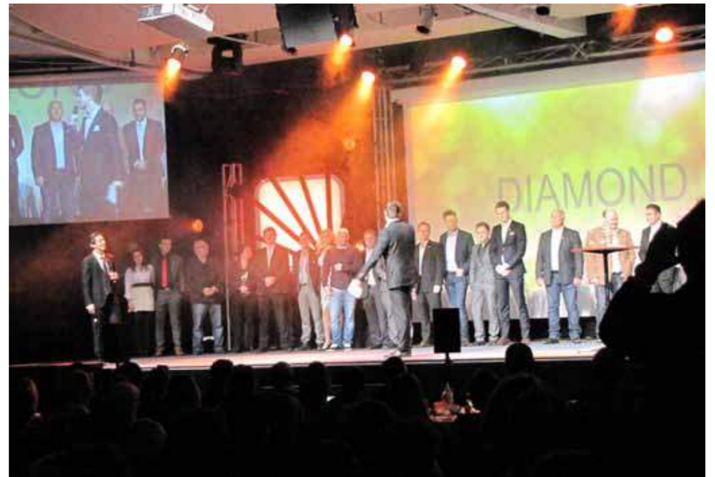
Høy stemning på lederskapstrening i direktesalgnettverket Zinzino.

Selv klarte han å bli Diamond på to måneder.