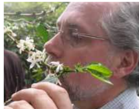
Tveitsme er jevnlig på reise i kaffeproduserende land. Her er han ute på kaffemarkene i Brasil