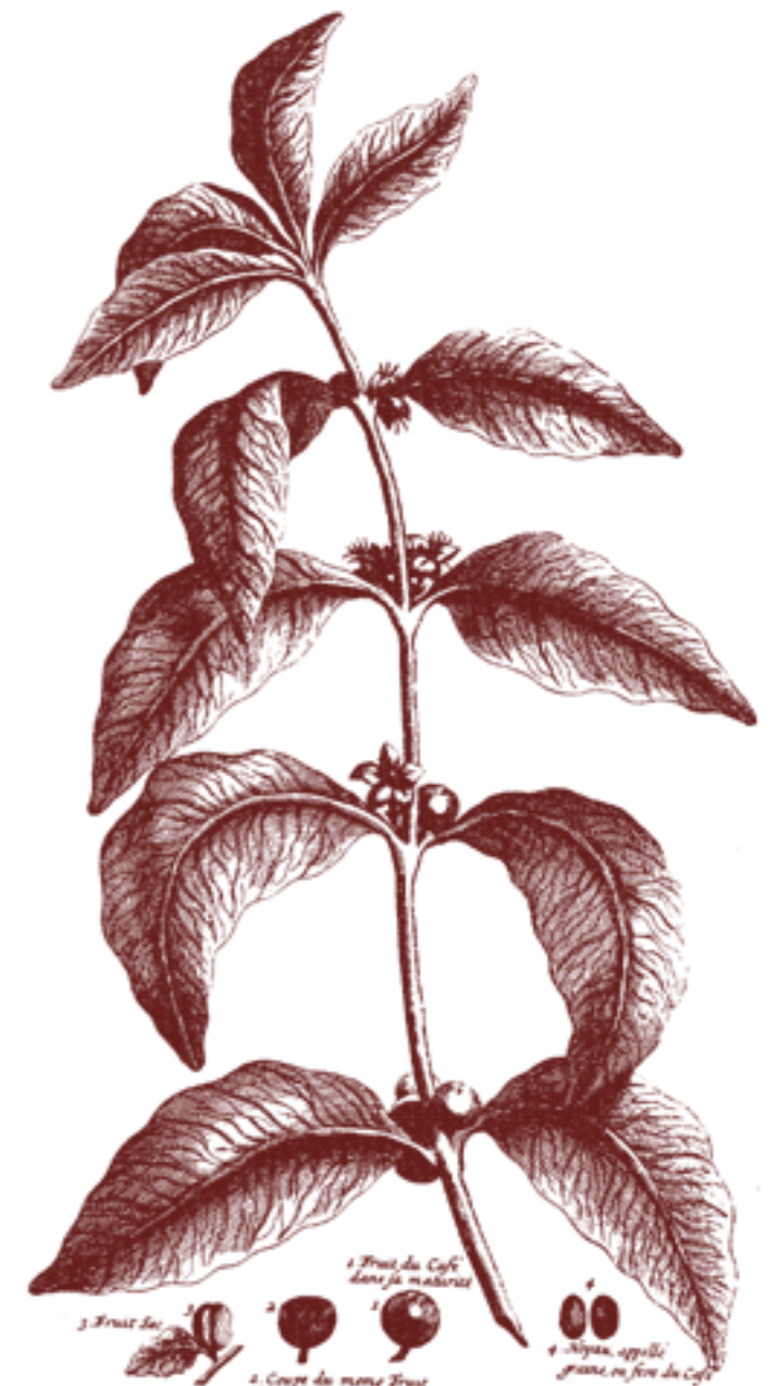
Kaffeplanten har både vært høyt aktet og demonisert gjennom tidene.

Under denne overskriften kommer også sykdommer i hjernens blodårer, hjerneslag eller «stroke». Som nevnt ovenfor skulle man vente at kaffe var knyttet til høyere risiko for sykdommer i arterier, hjerte og hjerne, men de fleste store observasjonsstudiene kan ikke bekrefte dette. Det er et par unntak, blant annet viste en norsk studie fra midten av 1990-tallet en økt risiko for død av hjerteinfarkt. Senere studier har snarere antydnet en tendens til beskyttende virkning. Tilsvarende funn har man når det gjelder hjerneslag. Denne tilsynelatende motsetning mellom kaffens fysiologiske effekter og manglende betydning som sykdomsårsak forklares i dag ved at kaffe også inneholder anti-oksideranter og