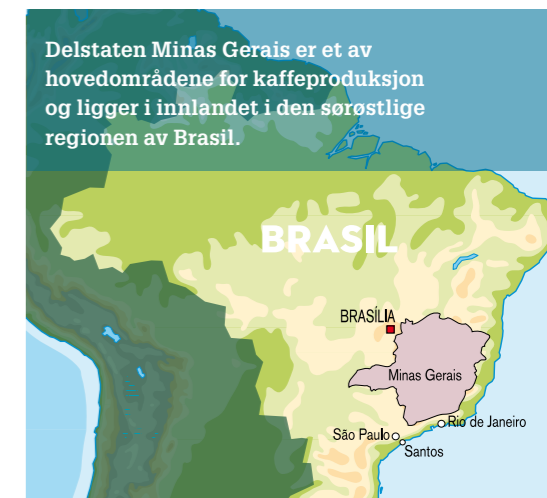
Delstaten Minas Gerais er et av hovedområdene for kaffeproduksjon og ligger i innlandet i den sørøstlige regionen av Brasil.